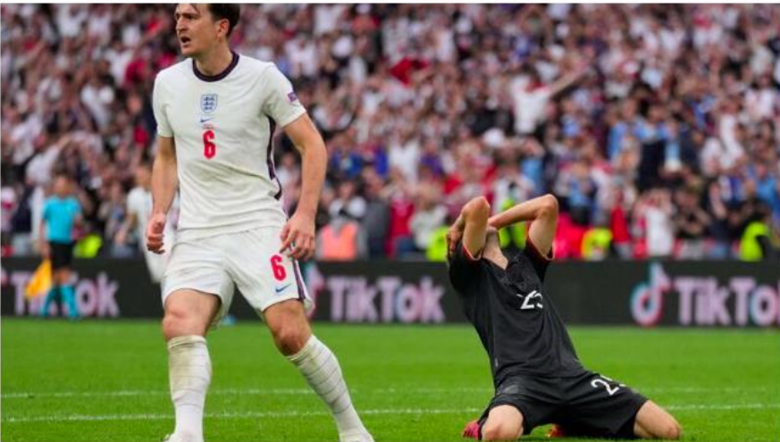
Germany's forward Thomas Mueller reacts to missing a goal opportunity during the UEFA EURO 2020 round of 16 football match between England and Germany at Wembley Stadium in London on June 29, 2021.