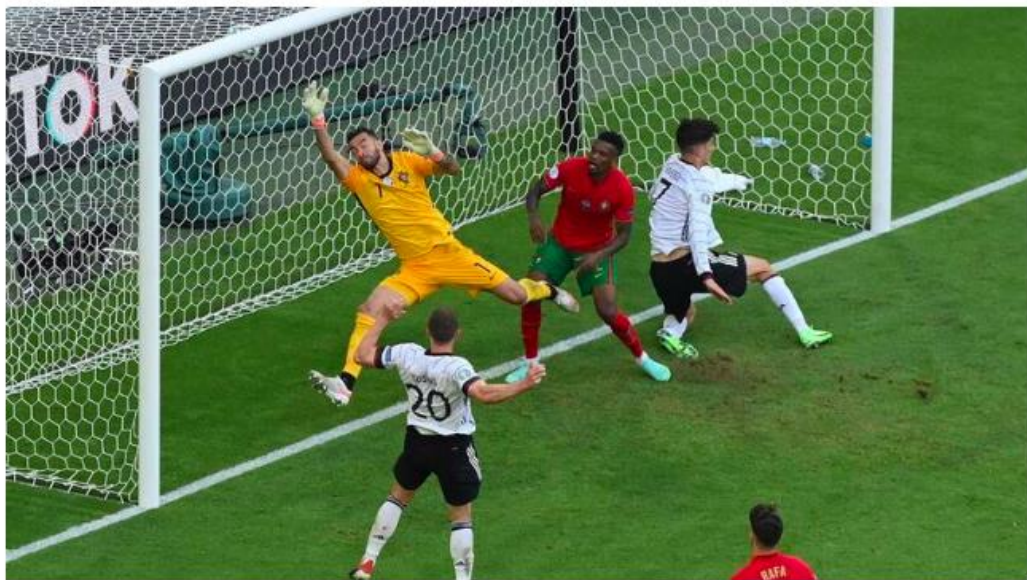
Germany's defender Robin Gosens (L) heads the ball to score their fourth goal during the UEFA EURO 2020 Group F football match between Portugal and Germany at Allianz Arena in Munich on June 19, 2021.