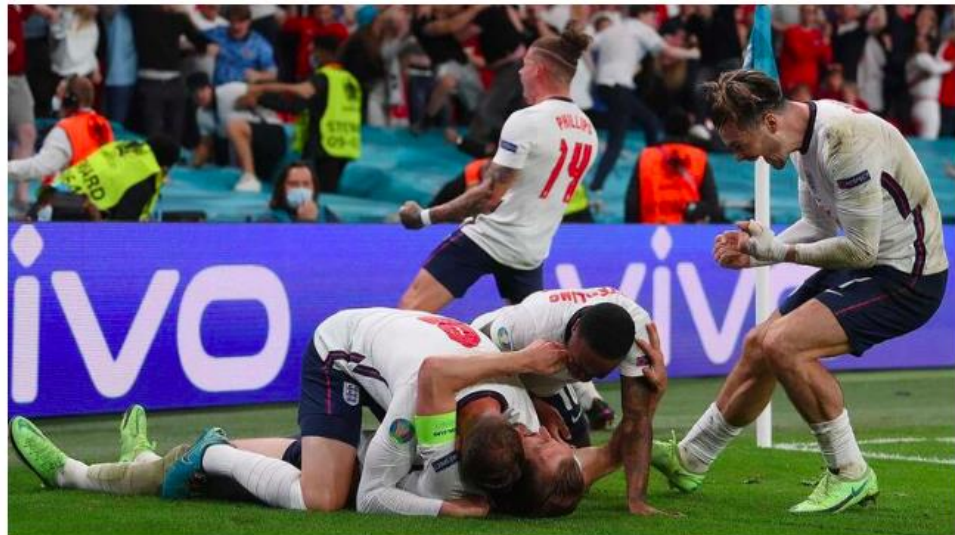
England's players celebrate the second goal during the UEFA EURO 2020 semi-final football match between England and Denmark at Wembley Stadium in London on July 7, 2021.