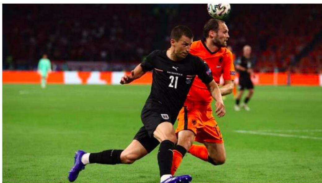
Jogo entre Países Baixos e Áustria, no Euro 2020.

O s Países Baixos receberam e venceram a Áustria por 2x0, num jogo que apurou a seleção da casa para a fase seguinte da competição. Os golos de Depay e de Dumfries permitiram que a equipa fizesse uma exibição tranquila perante os seus adeptos. A TVI foi a estação que transmitiu em direto a partida e contou com uma audiência média de 978 mil telespectadores, ou seja, cerca de 19.7% das pessoas que estavam a assistir naquele momento televisão no lar. Este foi o quarto programa mais visto do dia, ficando atrás das telenovelas da SIC e TVI e do Jornal da Noite da SIC. O jogo foi transmitido em simultâneo pela Sport TV1, que somou uma audiência média de 60 mil telespectadores e um share de 1.2%.