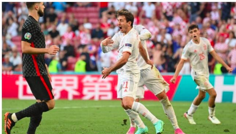
Espanha elimina Croácia em jogo de loucos