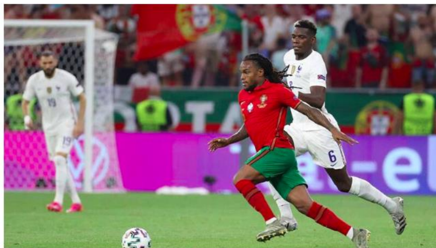
Renato Sanches em ação frente à seleção francesa