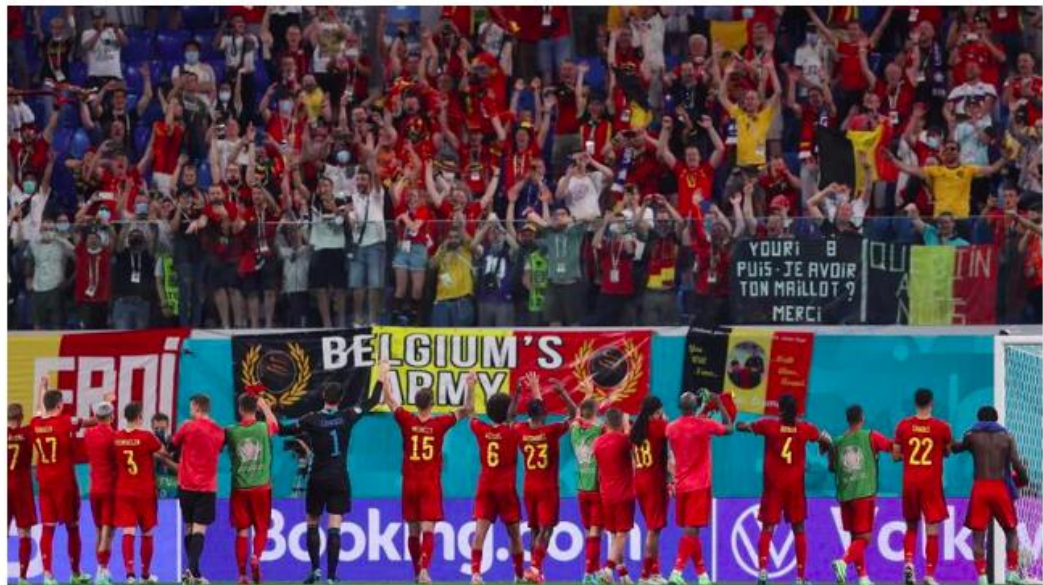
Seleção belga celebra vitória