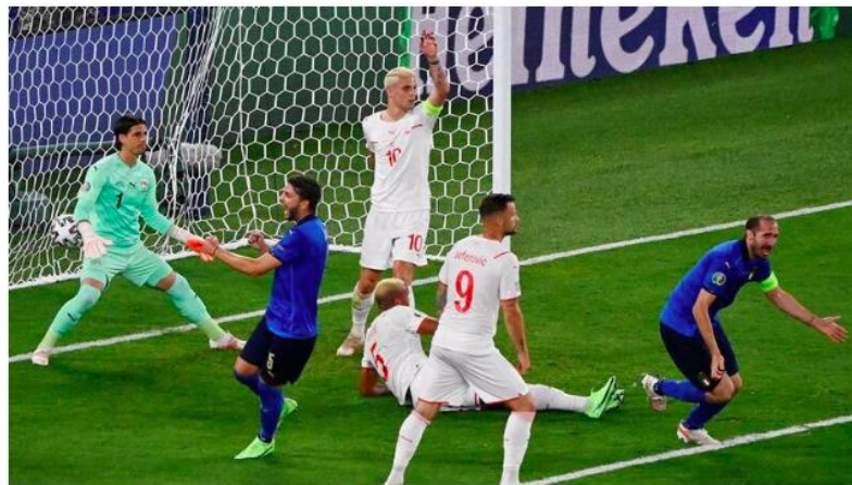
TOPSHOT - Italy's defender Giorgio Chiellini (R) celebrates after scoring, before the goal was disallowed for handball after a VAR check, during the UEFA EURO 2020 Group A football match between Italy and Switzerland at the Olympic Stadium in Rome on June 16, 2021.

A RTP1 transmitiu em direto a vitória da seleção italiana por 3 x 0 frente à Suíça. Com este resultado, a equipa orientada por Roberto Mancini assegurou a passagem à fase seguinte da competição. O jogo foi visto, em média, por mais de 1.1 milhões de portugueses, a que correspondeu um share de 24.9%.