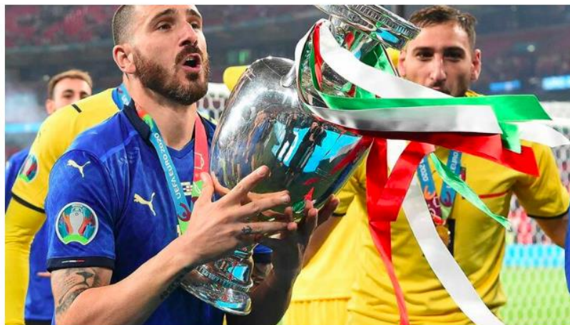
Mais de 4.5 milhões de portugueses viram a partida decidida nas grandes penalidades