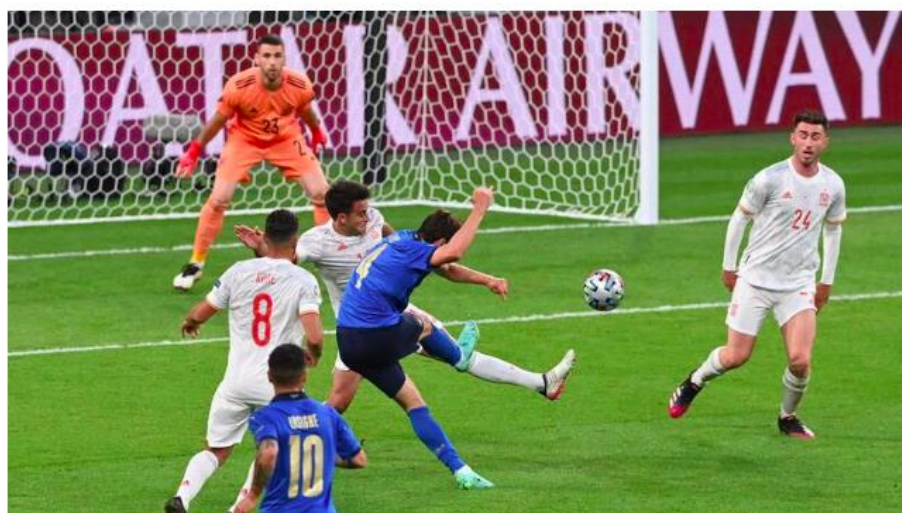
TOPSHOT - Italy's midfielder Federico Chiesa (C) shoots and scores his team's first goal during the UEFA EURO 2020 semi-final football match between Italy and Spain at Wembley Stadium in London on July 6, 2021.