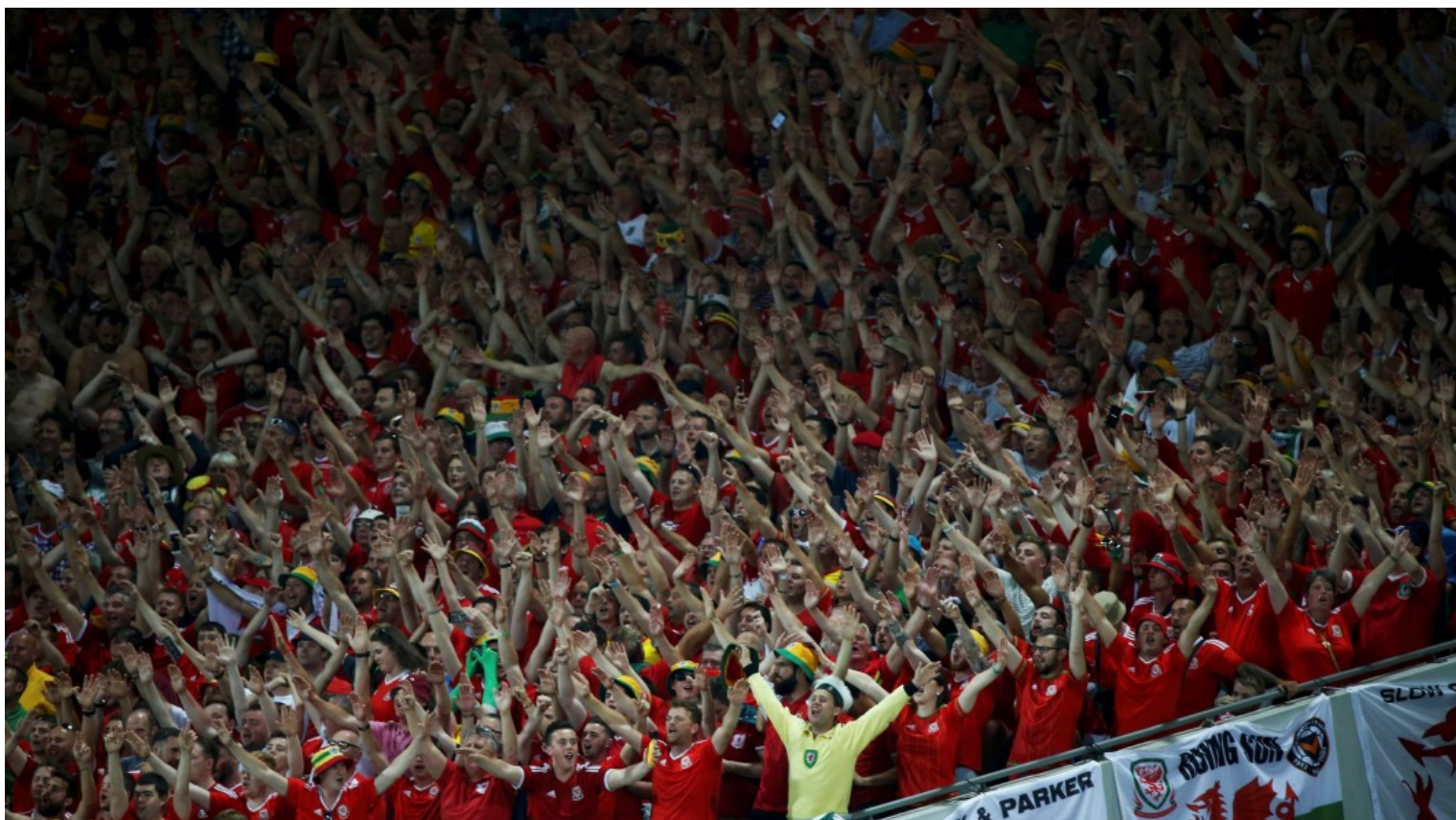
País de Gales vence a Rússia por 3-0